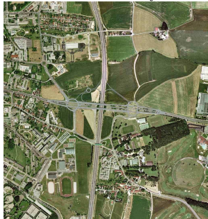
La situation à l'est de Dijon